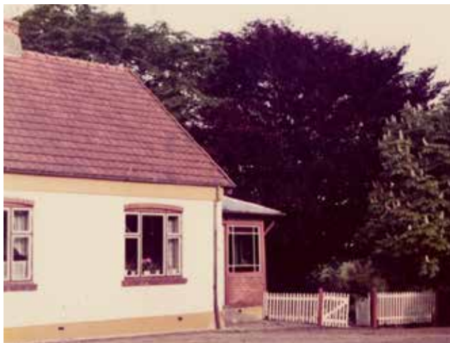
Det nybyggede stuehus fra 1912 på Lykkebjergvej

Efter 1974 fik Lykkebjergvej 13 en omskiftelig tilværelse med ejere, der kun kortvarigt var på adressen, og de gamle bygninger samt et udvidet nybyggeri på stedet er i de sidste 50 år blevet anvendt til vidt forskellige erhverv – lige fra øldepot til systue.