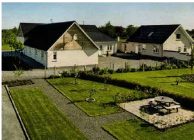
Lykkebjergvej 13 efter ombygning til bed & breakfast i 2007

Når man i dag ser disse flotte ombyggede og nyopførte bygninger, er det næsten umuligt at genskabe synet af den oprindelige lille landbrugsejendom, hvor tidligere ejere gennem årene har kæmpet med store økonomiske problemer, og hvor sygdom og død har været en del af tilværelsen for familierne.