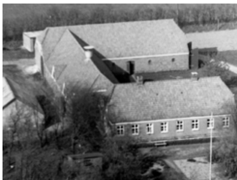
Askærgårdvej efter 1926