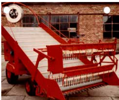
Denne første maskine Aage konstruerede som smed - en såkaldt "Parcel-græshøster" til forsøgsstationer.