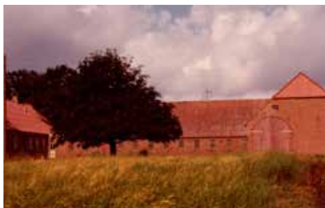
Askærgårdvej 17 ca. 1980