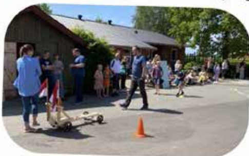
Opbakning til sæbekasseræs